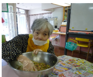
水はしっかり切って...