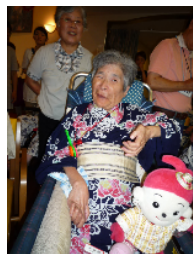
スイカ早食い女子の部？←