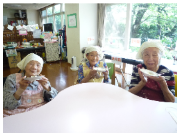
自分の餃子は自分で包みました

ご利用者さんとの会話の中で昔、中華料理屋さんに勤めていて...から始まって食べてみたいなく作ってみようよ♪ってことご利用者さんの教えのもとみんなでチャレンジしてみました。