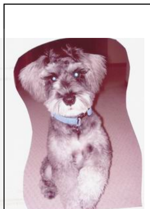
理事長の愛犬「いち」 も寂しい毎日です。